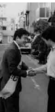
街頭にて区民とのふれあい

京都内で最低の投票率でした。これは誰がやっても同じであるという考えや、自分には関係ないというふうな無関心層が増えているのが原因のひとつだと考えられますが、やはり立候補した私たちを始め、金権汚職やリリーダシップの欠如など政治を行う側の問題があるのだと思います。身近な区政について区民の皆様にもっと関心を持ってもらうべく努力をしてまいりたいと思ひます。今回の選挙の結果、目黒区議会は、自民党一人・目黒区民会議七人・公明党六人・共産党五人・無所属七人という構成となりました。私も区議会