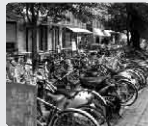
乱雑に停められている自転車