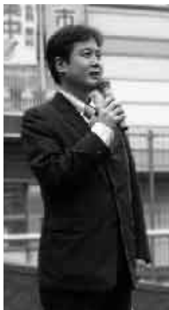
目黒の活性化に向け (目黒駅前にて)

この度の目黒区議会議員選挙に於きま して、皆様の暖かいご支援のもと、初当 選させていただきました。今回の当選者 の平均年齢は五二・六歳と改選前五八・ 六歳より六歳若返りました。特に自民党 に於きましては私を含め三人の三〇代 の区議会議員が誕生し、目黒区政及び党 の活性化となっております。しかし一方 投票率三六・四％という低投票率で、東