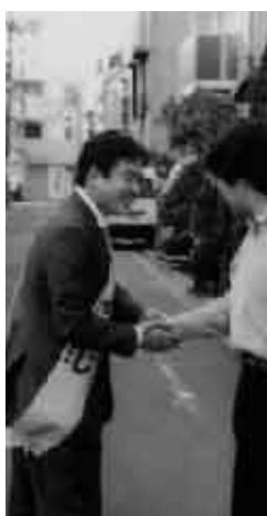
街頭にて区民とのふれあい

京都市内で最低の投票率でした。これは誰 がやっても同じであるという考えや、自分 には関係ないというふうな無関心層が増 えているのが原因のひとつだと考えられ ますが、やはり立候補した私たちを始め、 金権汚職やリリダーシップの欠如など政 治を行う側の問題があるのだと思います。 身近な区政について区民の皆様にもっと 関心を持ってもらうべく努力をしてまい りたいと思ひます。今回の選挙の結果、目 黒区議会は、自民党一人・目黒区民会議 七人・公明党六人・共産党五人・無所属七 人という構成となりました。私も区議会