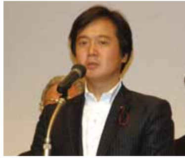
区議団代表として挨拶

本年度は区議団を代表する幹事長となりました。目黒区議会最大党派として、責任ある立場で区民の声を区政に反映するよう努力してまいります。